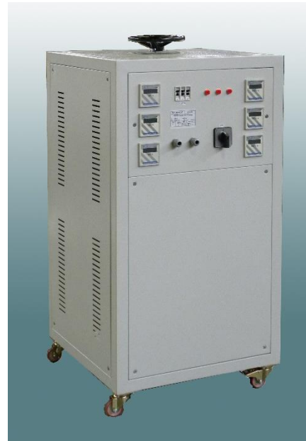
Three phase VAT range variable transformers – manual regulation