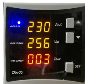
display misure e impostazioni

dimensioni e pesi sono solo indicativi e possono essere variati in qualsiasi momento senza alcun preavviso