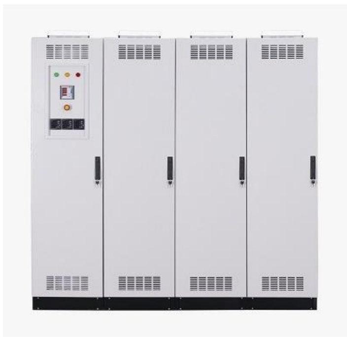
Figura 1 I prodotti rappresentati nelle immagini contengono accessori opzionali

La regolazione avviene in modo indipendente su ogni fase. Il sistema è dotato di un commutatore di bypass che consente di alimentare il carico con la tensione di rete in caso di malfunzionamento o necessità. Utilizzando i pulsanti di impostazione è possibile regolare la tensione di uscita, la gamma di precisione, la velocità di regolazione, ed i limiti di tensione alta-bassa. E' possibile poi regolare il controllo di corrente massima e il relativo tempo di isteresi. Un display visualizza la tensione di ingresso e uscita, e la corrente erogata, su ogni fase